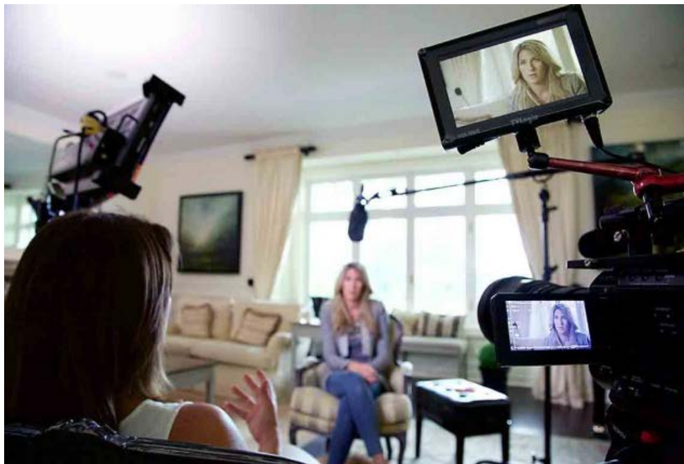
PHOTO TIRÉE DU DOCUMENTAIRE